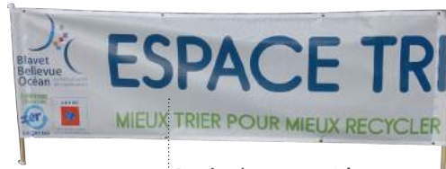
Banderole « espace tri »