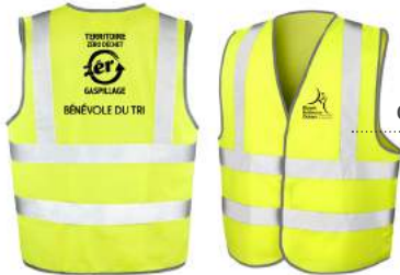
Gilets « bénévole du tri »