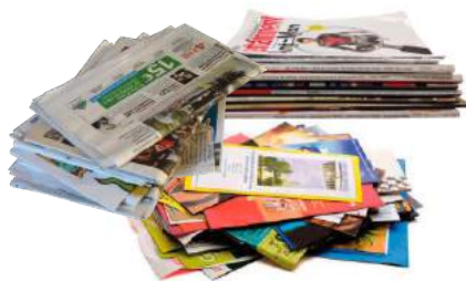
→ COLONNE À PAPIER