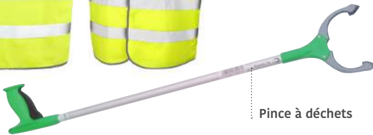
Pince à déchets