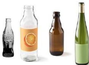
→ COLONNE À VERRE