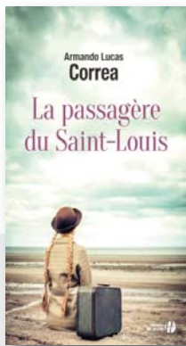
La passagère du Saint-Louis A.L. CORREA

Nos bibliothécaires partagent avec vous leurs coups de cœur du moment !